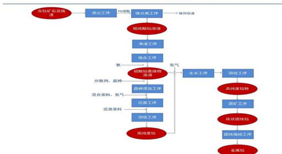
金属钴冶炼工艺图

本报告从钴行业近年的市场现状、供求状况、消费领域,钴产量、进口、出口等基础数据到行业利润、行业发展机遇等深度解析,在回顾 2021 年市场的同时,为产业链的各企业提供 2022 年投资建议。