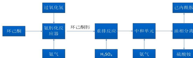
己内酰胺工艺流程图

本报告从己内酰胺-锦纶行业近年的市场现状、供求状况、产能产量、进出口等基础数据到行业利润、行业发展机遇等深度解析，在回顾 2021 年市场的同时，为产业链的各企业提供 2022 年投资建议。