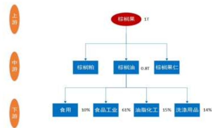
棕榈油产业链流程图

本报告从棕榈油行业近年的市场现状、供求状况、消费领域，棕榈油产量、进口、出口等基础数据到行业利润、行业发展机遇等深度解析，在回顾 2021 年市场的同时，为产业链的各企业提供 2022 年投资建议。